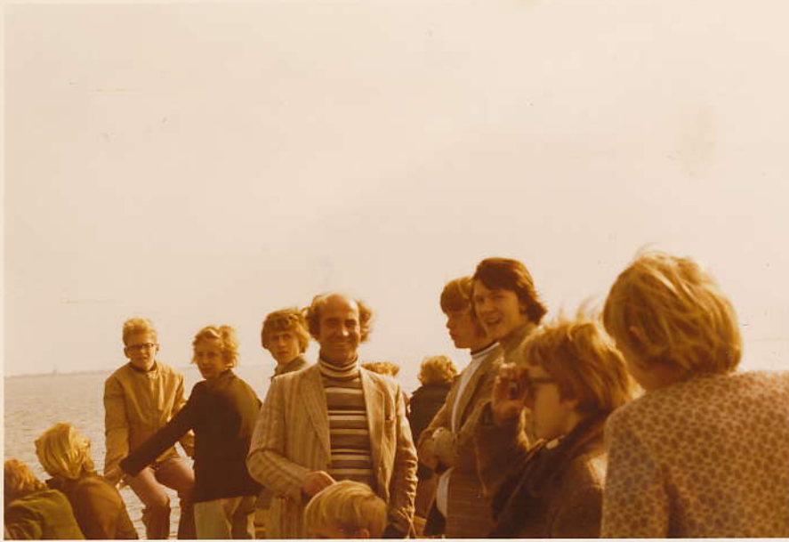
op t dek...