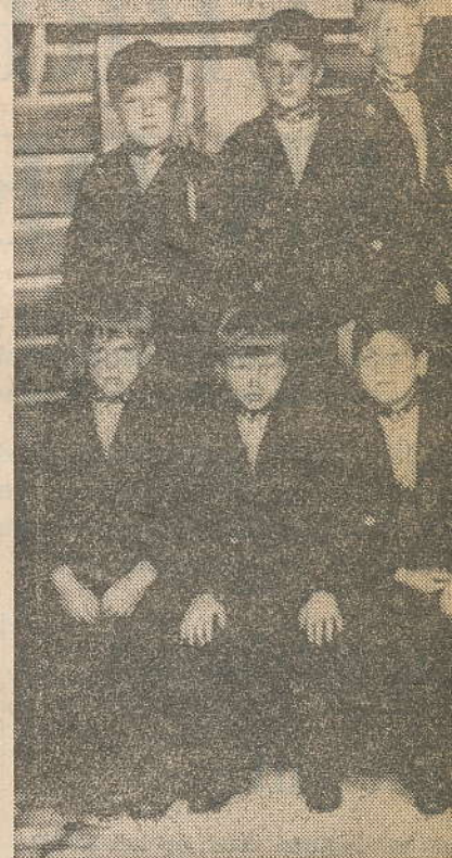
De Zangertjes van Volendam, een jongenskoor met internationale faam

niet alleen de muziek bij, het gaat om de algehele begeleiding. Het jongenskoor is een van die organisaties die jeugd van de straat houdt. Die voorko dat zij zich vervelen. Vandaar de vakties, het vele bijeen zijn. Zelfwerkzaamheid is een der peilers waarop het koor is gebaseerd. Zelfwerkzaamheid ook de ouders bij het werk betrekt met succes. Een oproep van meester Beumer en de beurzen gaan open.