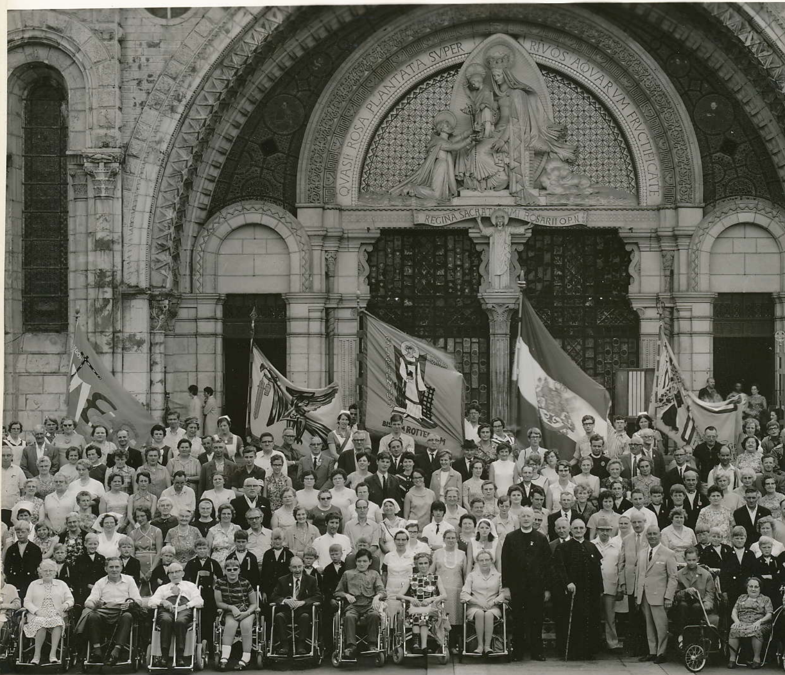
Nederlandse Bedevaart Lourdes 22-29 Juli 1969