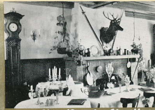
HOTEL - CAFÉ - RESTAURANT „Het Roode Hert”