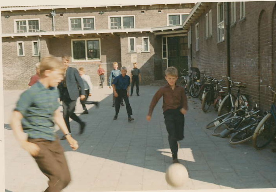
Jan 1966 aan de bal.