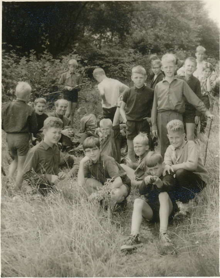
even met blazen.