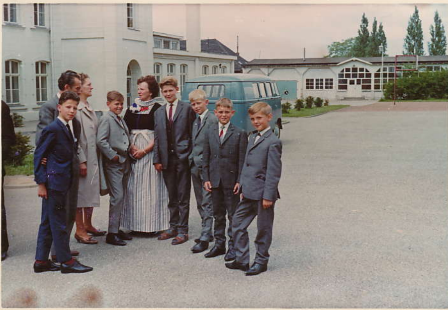
Besoeftog in Valkenburg