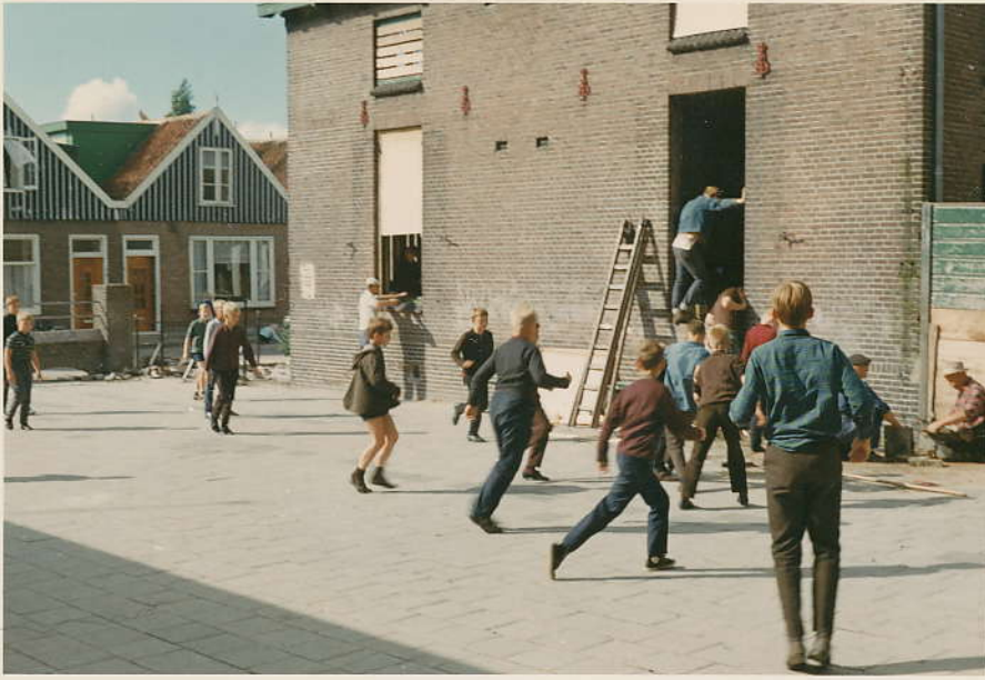
mei 1966 op de speelplaats van Meester Dwaerthoud m'n school.