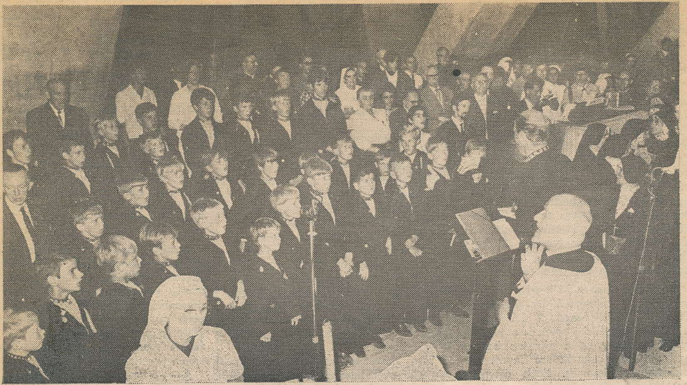
Les Petits Chanteurs de Volendam qui ont animé la liturgie du Pèlerinage National Hollandais.