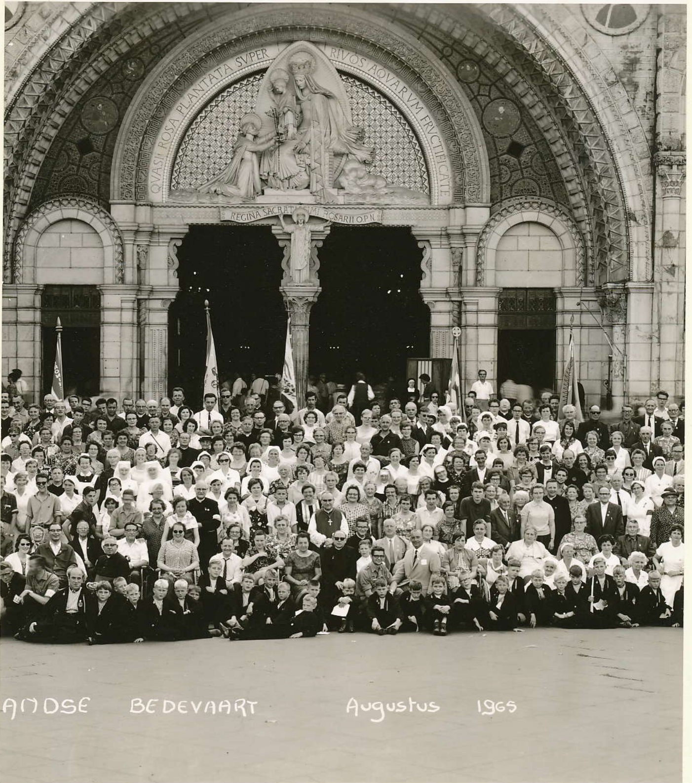
ANDSE BEDEVAART Augustus 1965