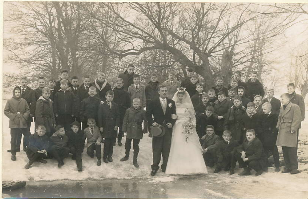
10 februari 1963. Broer Joop!