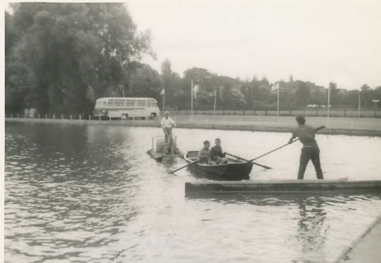
Bij de Petrus Obloten.