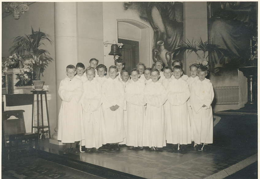
Dagelijks de requiem-mis op 't altaar