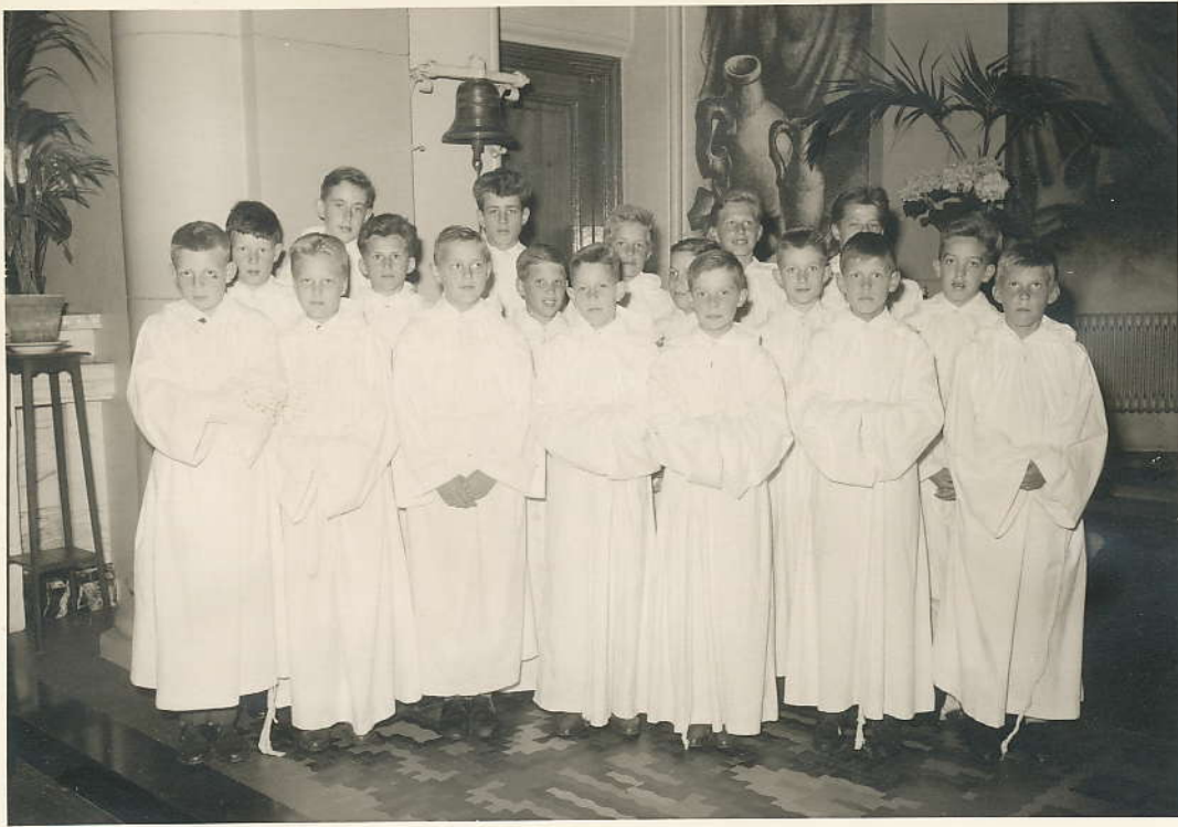
In witte alben gestoken zingen zij bijna