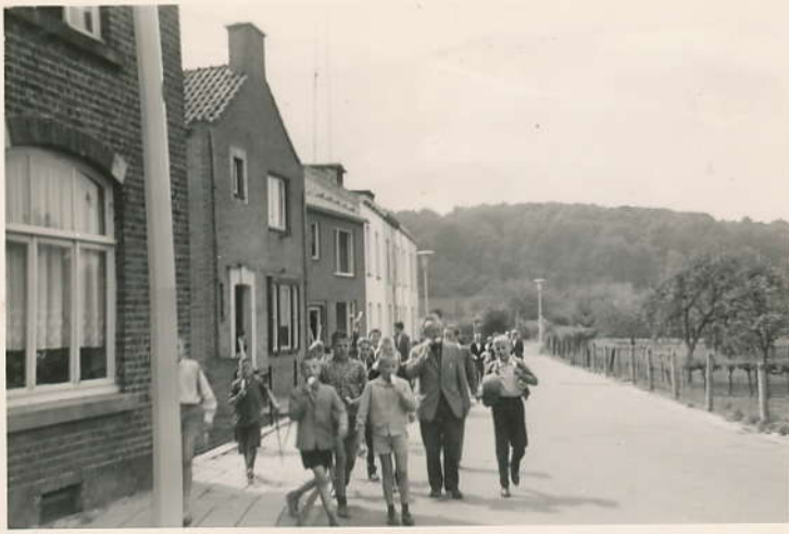
Terug van't Ruembad in Valkenburg. Aug. 63.