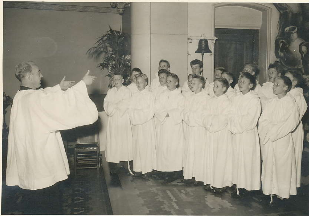
in de St. Vincentiuskerk te Volendam