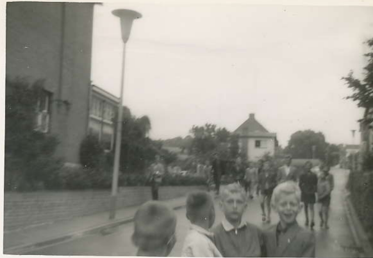
Op vakantie in Valkenburg