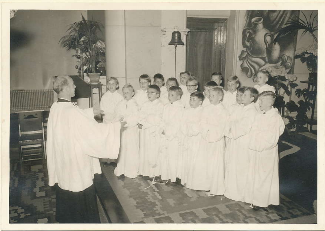
Staande op 't oude altaer. vóóren.