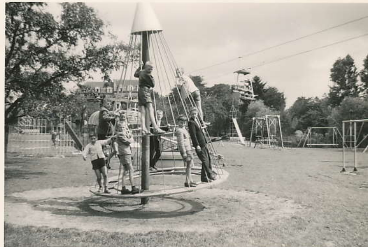
Spelthuin in Valkenburg.