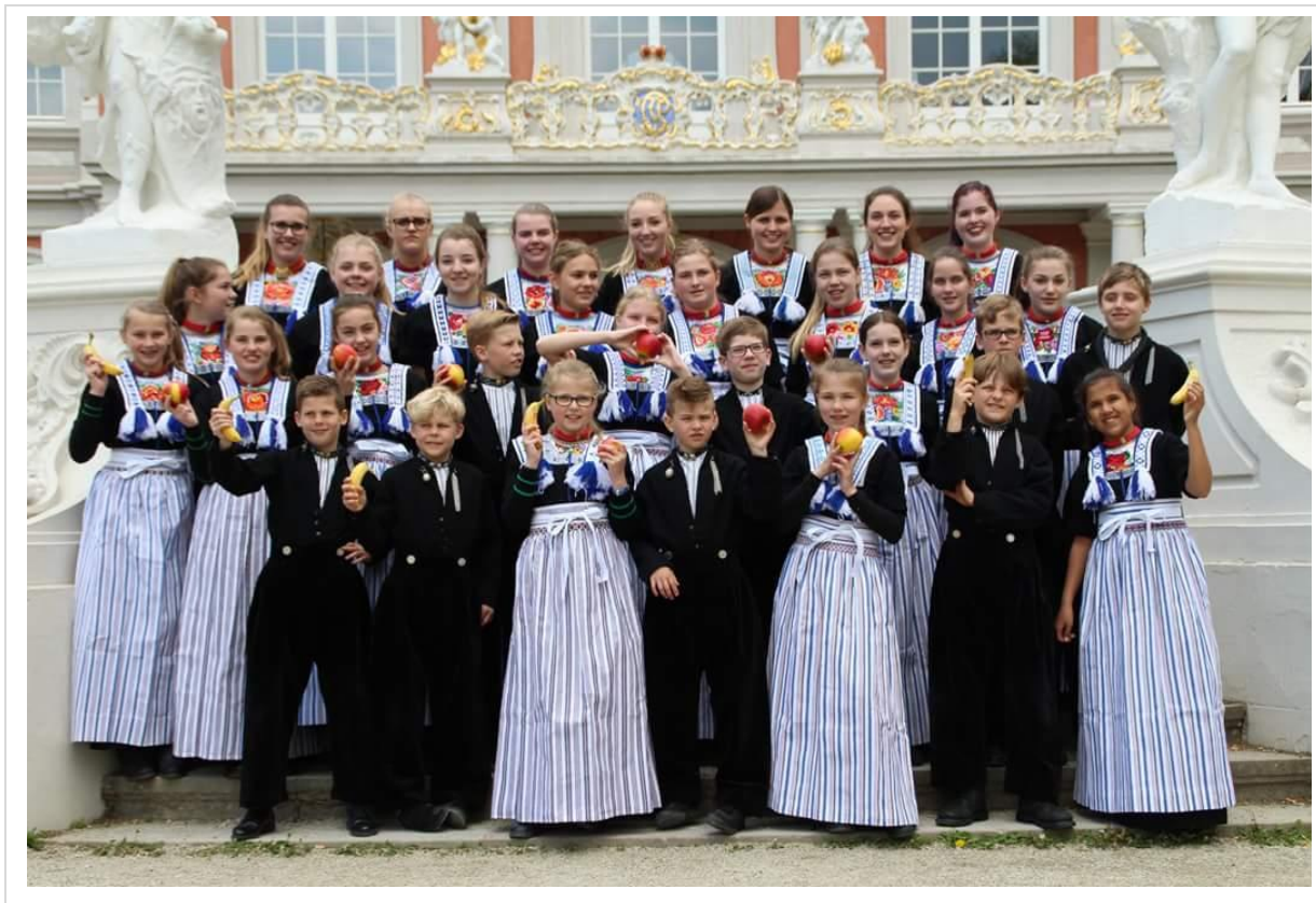
De zangertje trekken erop uit, met Rijkeberg en voor de gezondheid wat fruit. Oh oh oh wat een plezier in het beeldschone Trier.