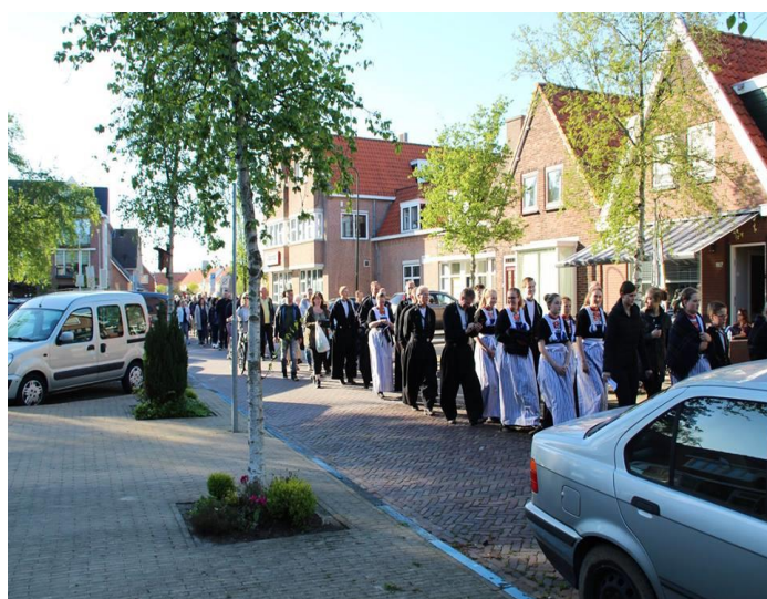
Hemelvaart 10 mei 2018