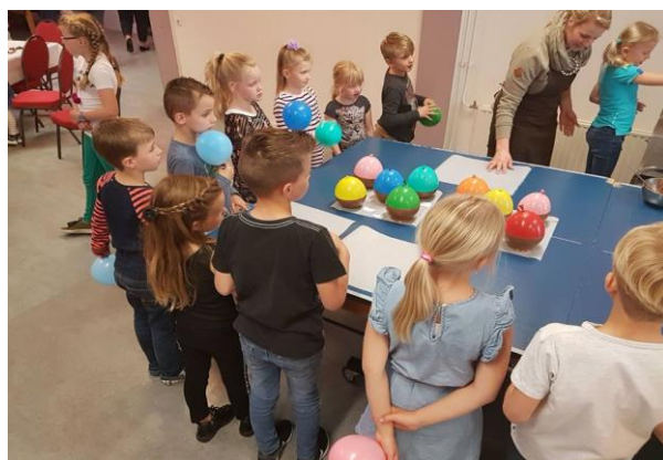
Jaarlijks uitje van de Aspiranten en Benjamins 2018